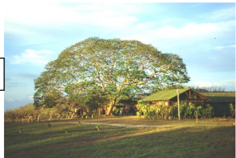
Frucht des Ohrenfruchtbaumes